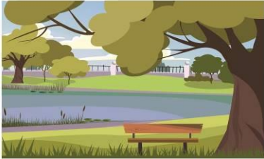
de la peinture